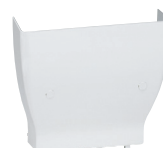
0 300 95